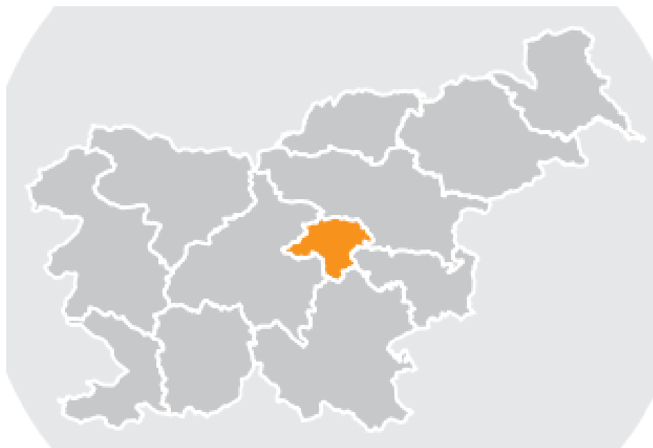
Slika 1: Zasavska regija

Zasavska regija je z 485 km 2 površine in 57.061 prebivalci (Vir. SURS, leto 2018) druga najmanjša med dvanajstimi slovenskimi statističnimi regijami. Zasavje sestavljajo občine Hrastnik, Trbovlje, Zagorje ob Savi in Litija. Občina Litija je na podlagi Uredbe (ES) št. 1319/2013 z dne 9. decembra 2013 o spremembi prilog Uredbe (ES) št. 1059/2003 Evropskega parlamenta in Sveta z dne 26. maja 2003 o oblikovanju skupne klasifikacije statističnih teritorialnih enot (NUTS), z dnem 1. 1. 2015 prešla iz Osrednjeslovenske v Zasavsko statistično regijo.